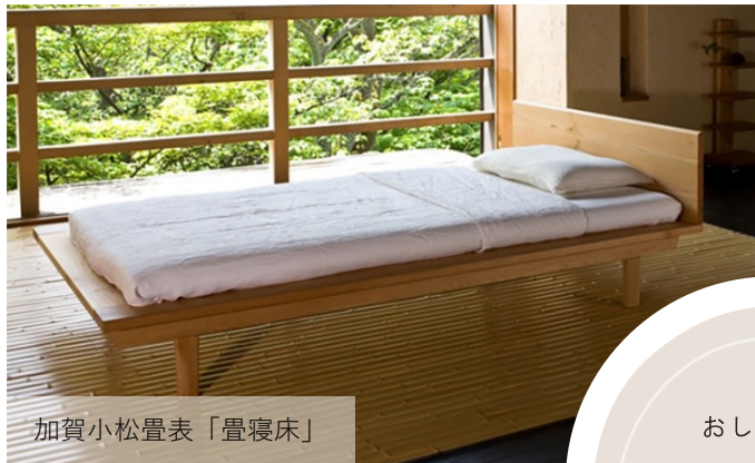
加賀小松畳表「畳寝床」